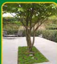
Meerstammige bomen: echte eyecatchers in je tuin