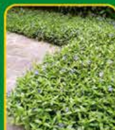
Bodembedekkers: voor een tuin zonder onkruid

Verkozen tot Beste Plantencentrum van België 2023-2024