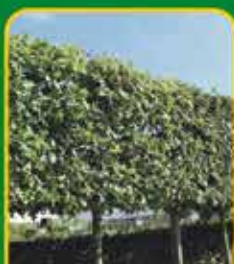
Leibomen: voorkomen inijk van de buren

In het najaar is de bodem nog opgewarmd van de voorbije zomer waardoor planten zich gemakkelijker inwortelen. Goed gewortelde planten groeien in de lente een stuk beter en sneller!