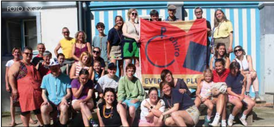
Chiro Eversheim Plus zoekt extra leiders en leidsters.