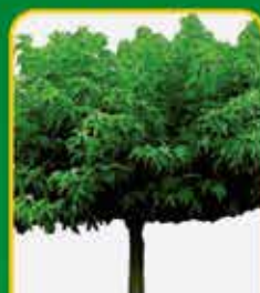
Dakbomen: voor natuurlijke schaduw in de zomer