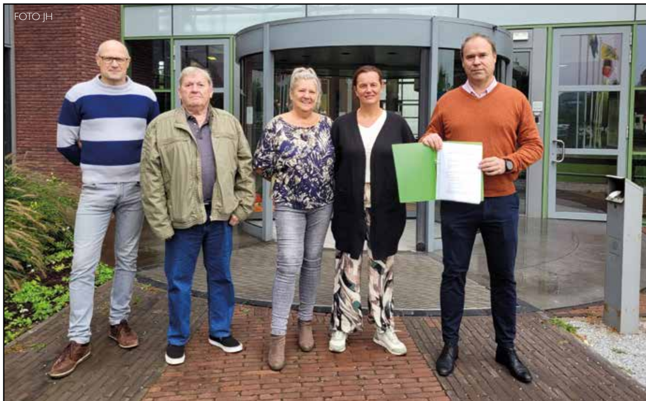
Buurtbewoners van de Linde kwamen naar het Administratief Centrum om een petitie te overhandigen.

MEISE - De buurtbewoners rond de Linde in Sint-Brixius-Rode kanten zich tegen een uitbreiding van de site en overhandigden een petitie aan het schepencollege. Ze vrezen meer overlast bij een uitbreiding van de site, waar momenteel onder andere de scouts, chiro en jeugdhuis den Droes hun lokalen hebben.