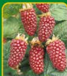
Fruitstruiken: lekker én gezond