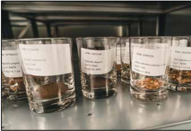
In de zadenbank worden zaden aan min 20 graden celcius bewaard.

In mei 2024 zette de Plantentuin nog een grote stap voorwaarts met de inhuulding van de zadenbank van de nieuwste generatie. “In combinatie met het nieuwe kassencomplex de Groene Ark beantwoorden we met deze infrastructuur aan cruciale conservatie doelstellingen”, gaat Godefroid verder. “Aangezien natuurbescherming een regionale bevoegdheid is, zullen we de oogst van zaden nu in het zuiden van het land voortzetten om een gelijkaardig resultaat te bereiken voor de flora op de Waalse Rode Lijst”, klinkt het verder. “Dit opmerkelijke resultaat illustreert het engagement van Plantentuin Meise voor het behoud van de biodiversiteit en markeert een belangrijke stap in de richting van het duurzaam behoud van de bedreigde flora in België.” “De Plantentuin in Meise maakt met zijn internationaal vermaarde verzamelingen naam en faam in binnen- en buitenland”, laat minister-president Matthias Diependaele (N-VA) in een reactie weten in een persbericht. “Deze mijlpaal benadrukt nogmaals de vooruitgang die Vlaanderen samen met onderzoeksinstellingen boekt op het vlak van expertise en innovatie in de ecologie.” (jh)