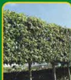
Leibomen: voorkomen inkiijk van de burens

Goed gewortelde planten groeien in de lente een stuk beter en sneller!