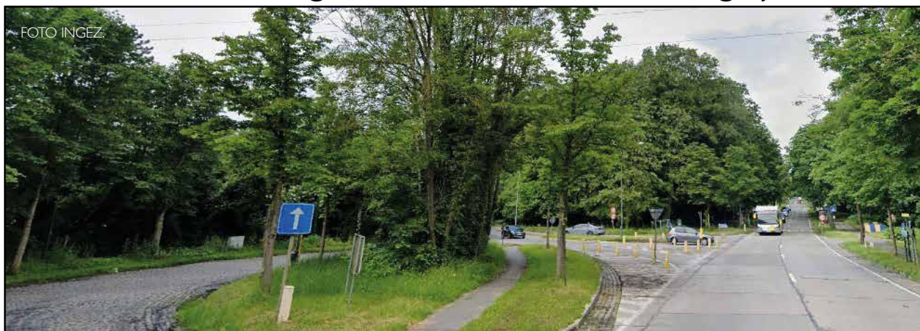
De werken aan de Drijpikkel zijn hoognodig, maar zijn uitgesteld.