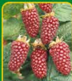
Fruitstruiken: lekker én gezond