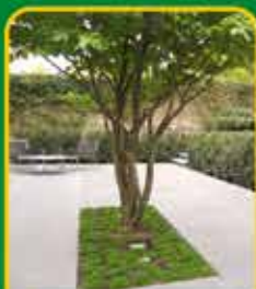
Meerstammige bomen: echte eyecatchers in je tuin