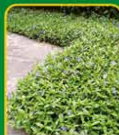
Bodembedekkers: voor een tuin zonder onkruid

Verkozen tot Beste Plantencentrum van België 2023-2024