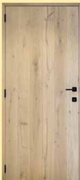
EFR 114 1/2 massief eik met knopen Onregelmatig planchette Natuurlijk uitzicht