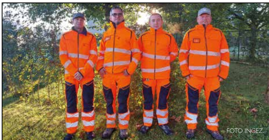
De medewerkers van de Technische Dienst kregen een nieuwe outfit.

GRIMBERGEN - De medewerkers van de technische diensten van het gemeentebestuur van Grimbergen gaan sinds kort aan de slag in hun gloednieuwe kledij. Deze kledij sluit aan bij de huisstijl die enkele jaren geleden werd gelanceerd.