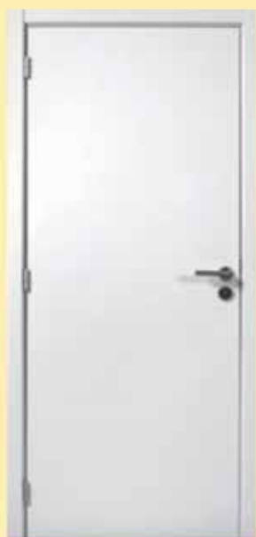
WITLAK 9010 Ral 9010 T verbinding Honingraat plaat 6 mm

FIETSPAD - Er is eindelijk zicht op de aanleg van een fietspad in de Meerstraat en Beigemsesteenweg in Grimbergen. Daarbij zal ook het zuidelijke deel van de Meerstraat tussen de Parklaan en Beigemsesteenweg worden aangepakt. Het gaat om een investering van zo'n 6,2 miljoen euro. De werken zijn in de komende legislatuur voorzien. (jh)