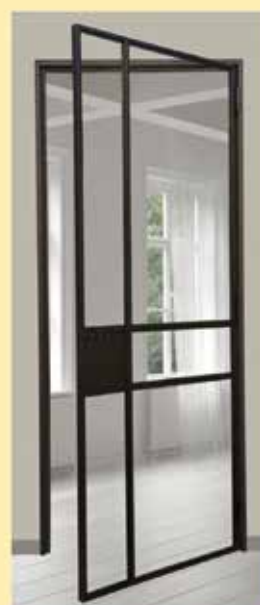
SMEED 5 Draaideur poederlak zwart 83,5 X 202,5 cm Gelast profiel Zeer stevig !