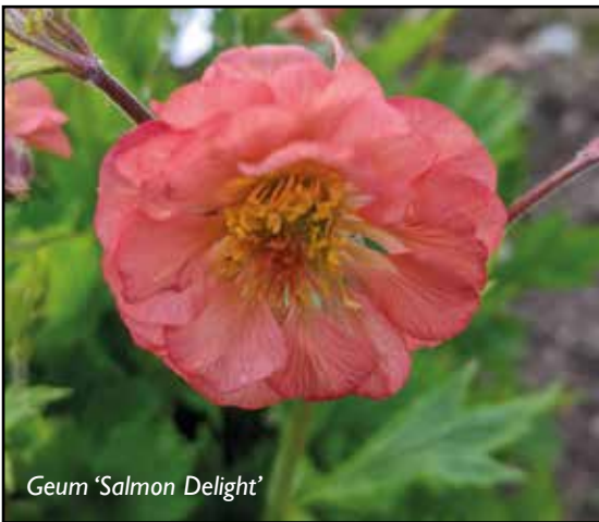
Geum 'Salmon Delight'