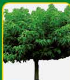
Dakbomen: voor natuurlijke schaduw in de zomer