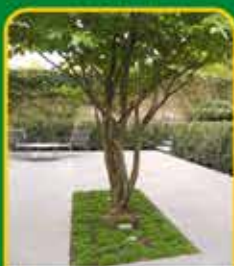
Meerstammige bomen: echte eyecatchers in je tuin