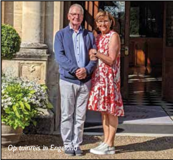
Op tuinreis in Engeland