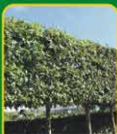
Leibomen: voorkomen inkijk van de burens

In het najaar is de bodem nog opgewarmd van de voorbije zomer waardoor planten zich gemakkelijker inwortelen. Goed gewortelde planten groeien in de lente een stuk beter en sneller!