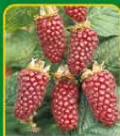
Fruitstruiken: lekker én gezond