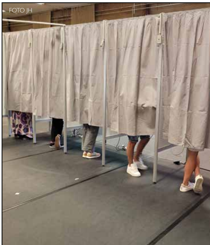
Het wordt koffiedik kijken hoe de kiezer de kaarten in Grimbergen op zondag 13 oktober legt.