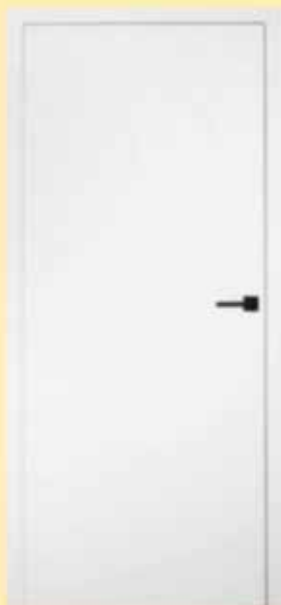
PORTO Ral 9003 Onzichtbare scharnieren Magneet sloten Omlijsting en deur gelijkliggend