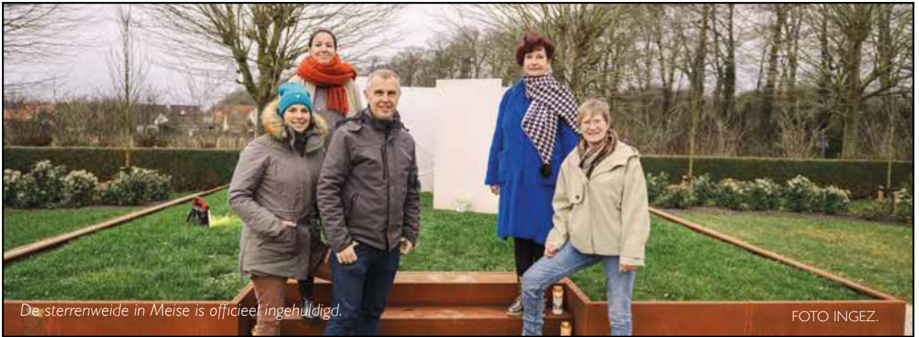
De sterrenweide in Meise is officieel ingehuldigd.