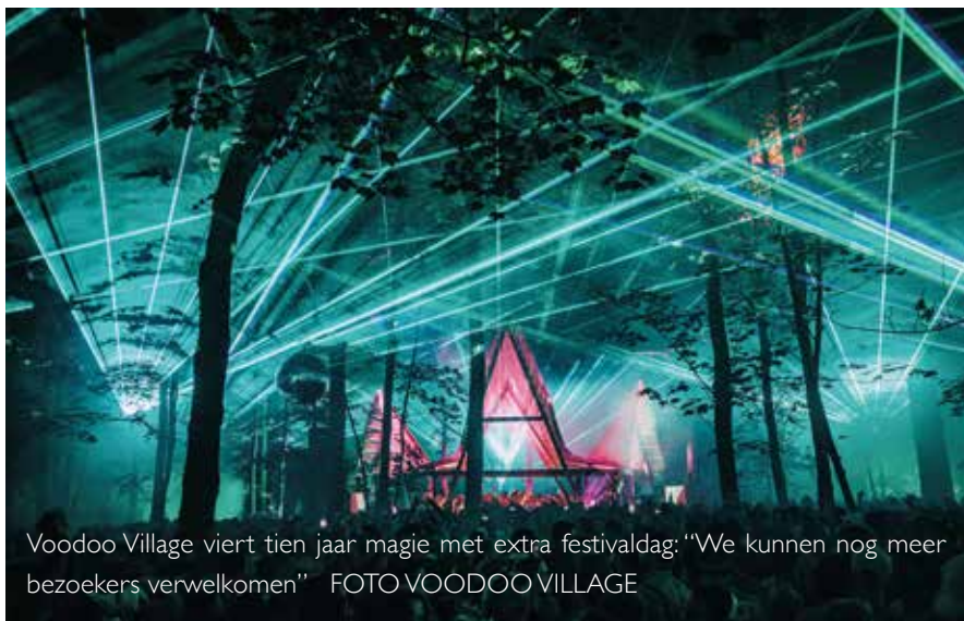
Voodoo Village viert tien jaar magie met extra festivaldag: "We kunnen nog meer bezoekers verwelkomen"