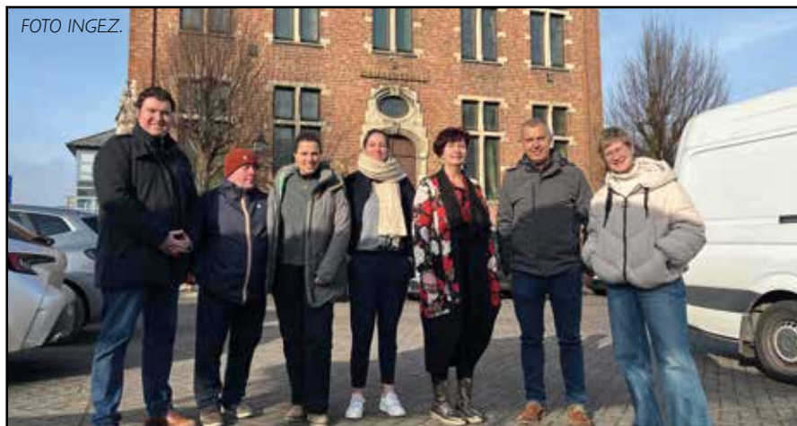
Er is een oplossing voor het oud gemeentehuis van Wolvertem, dat eerst zal worden gerenoveerd.